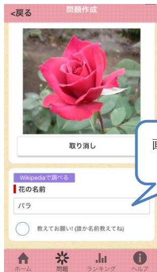
【問題作成画面（上部）】