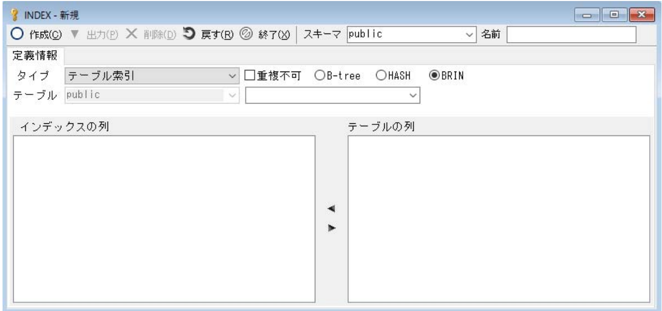
画面3. インデックス画面

インデックス画面において、BRIN の作成を行うことができるようになりました。インデックス画面では、B-tree/HASH/BRIN の 3 種類のインデックスを作成できます。(画面3)