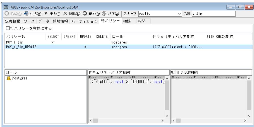
画面1. テーブル画面([行ポリシー]タブ)

テーブル画面に[行ポリシー]タブを新設し、行セキュリティポリシーの有効/無効を設定できるようにしました。当該テーブルに紐づく行セキュリティポリシーは、このタブから一覧で確認することができます。適用される行セキュリティポリシーを効率よく把握することが可能です。(画面1)