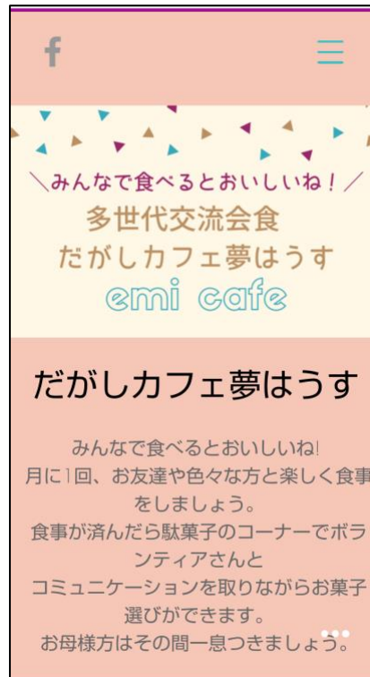
「だかしカフェ夢ほうす」のスマホトップ画面

https://sikodomoshokudo.wixsite.com/ks-sokaaoharu