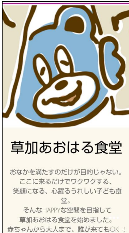
「草加あおはる食堂」のスマホトップ画面

に 15、16 件ほどのホームページをオープンする予定です。また、当社の作ったフレームを利用してホームページを作成してくれるボランティアも募集しています。