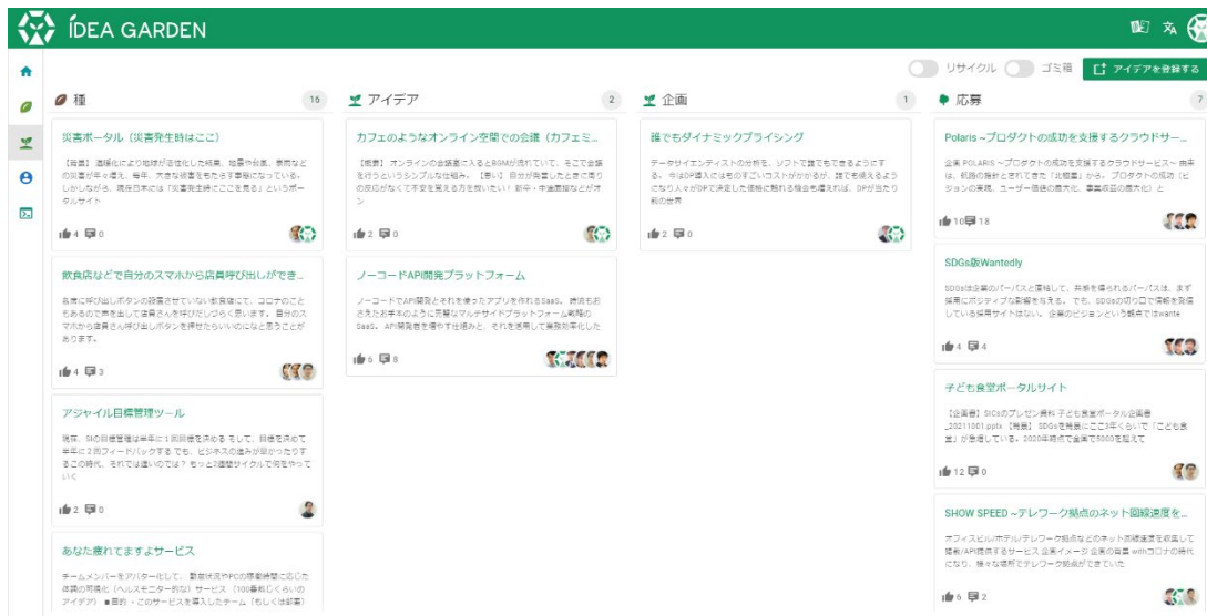
「Garden Board」画面で種からアイデアを育てる

アイデアに期という概念はありません。年々蓄積していけば、アイデアは会社の貴重な資産になります。古い種を再発見して水をやり、きれいな花を咲かせることもできるでしょう。